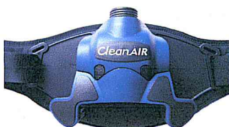
Clean-AIR Chemical 3F Plus