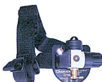
Clean-AIR Pressure Flow Control