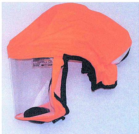
Krátká kukla Clean-AIR CA-1 oranžová