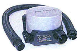
Clean-AIR Basic 2000 Flow Control