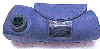
CleanAIR Chemical 2F Plus TH3