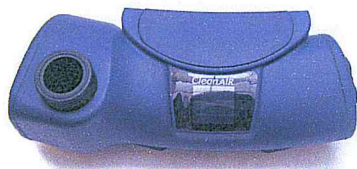
Clean-AIR Chemical 2F Plus