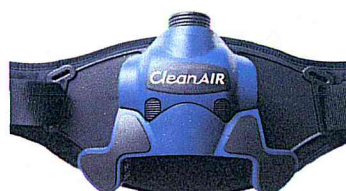
CleanAIR Chemical 3F Plus TH3