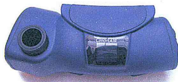
Clean-AIR Chemical 2F Plus