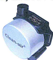
Clean-AIR Basic 2000 Dual Flow

Brusný štít CA-3 / Ochranný štít CA-3A jsou tvarově stejné, liší se pouze použitým materiálem na hledí.