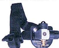
Clean-AIR Pressure Flow Control