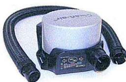
Clean-AIR Basic 2000 Flow Control