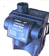
Clean-AIR Chemical Dual Flow