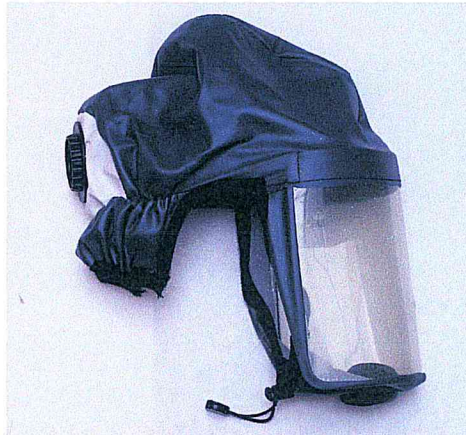
Krátká kukla Clean-AIR CA-1 modrá