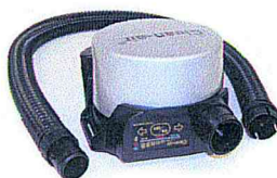
Clean-AIR Basic 2000 Flow Control TH3