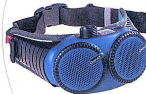
CleanAIR AerGO TH3