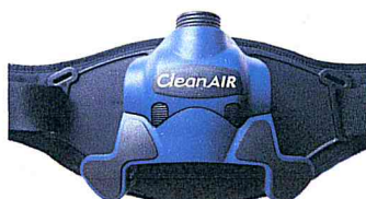
Clean-AIR Chemical 3F Plus