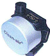
Clean-AIR Basic 2000 Dual Flow TH1