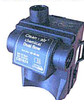
Clean-AIR Chemical Dual Flow