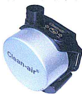
Clean-AIR Basic 2000 Dual Flow