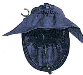
standardní rouška s kápí