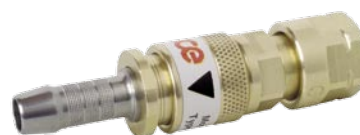
použití • use