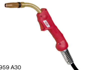
112 P959 A30