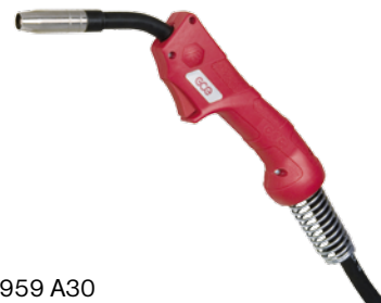
102 P959 A30