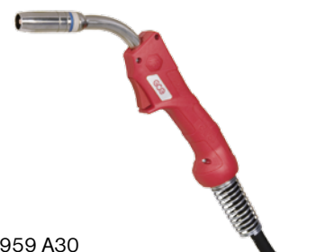
103 P959 A30