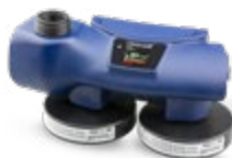
Pressure Flow Master